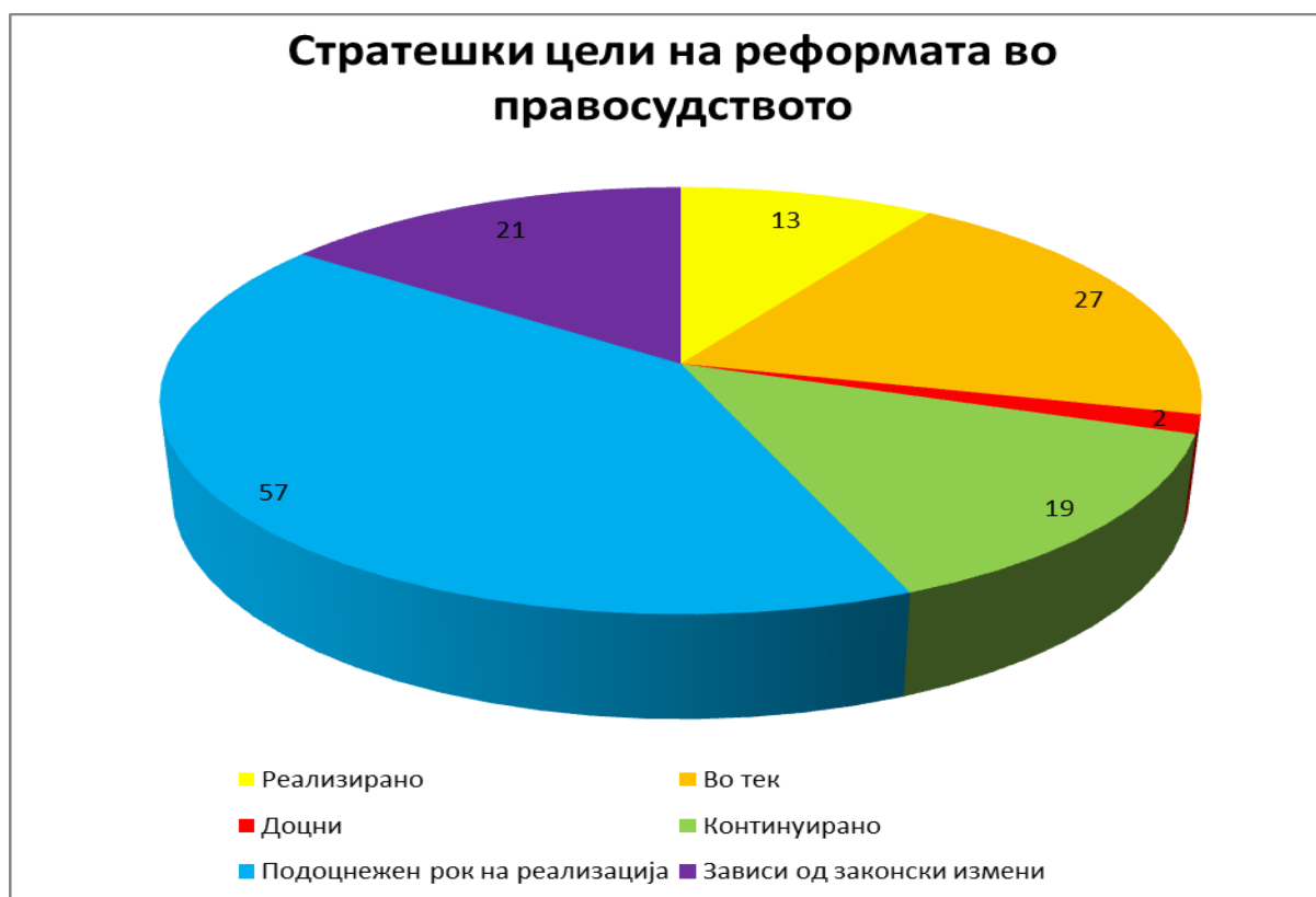
Прилог 3: Преглед на реализирани активности оддел Стратешки цели на реформата во правосудството