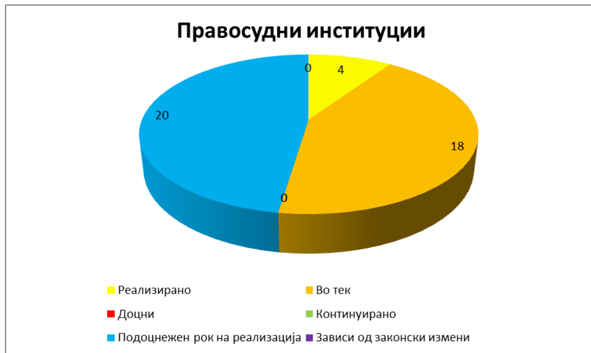
Прилог 5: Преглед на реализирани активности оддел Правосудни институции