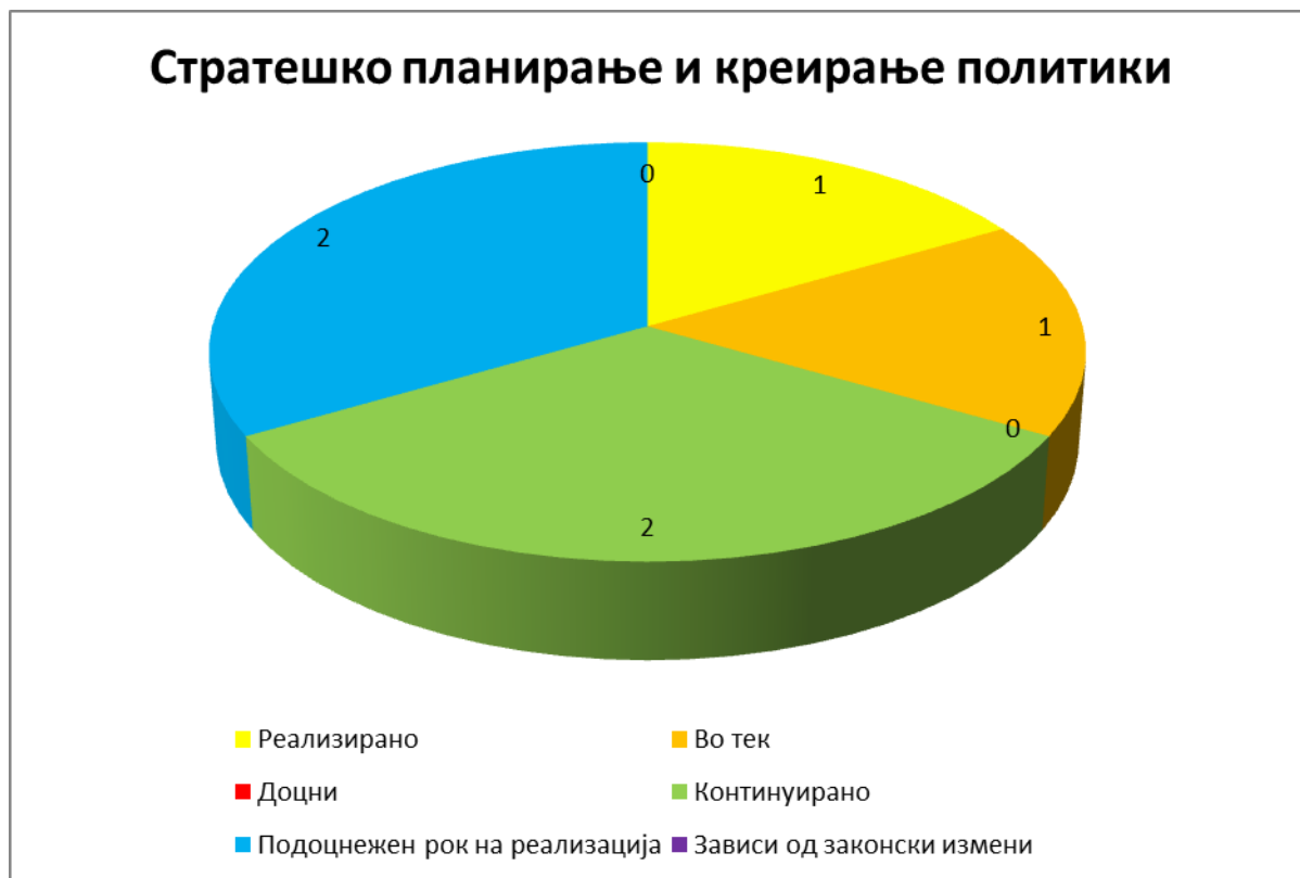
Прилог 4: Преглед на реализирани активности оддел Стратешко планирање и креирање политики