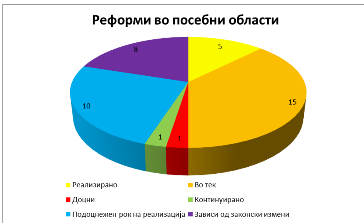
Прилог 6: Преглед на реализирани активности оддел Реформи во посебни области